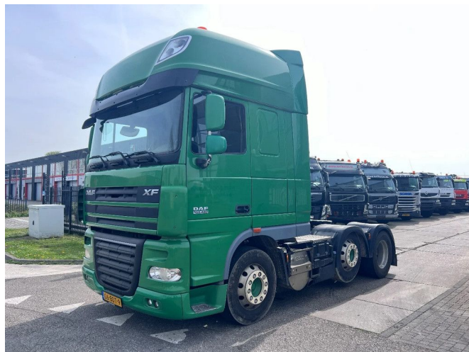
DAF XF 105.460 SSC 6X2 EURO 5