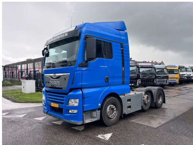
MAN TGX 26.460 XLX 6X2-2 EURO 6 LIFT AXLE