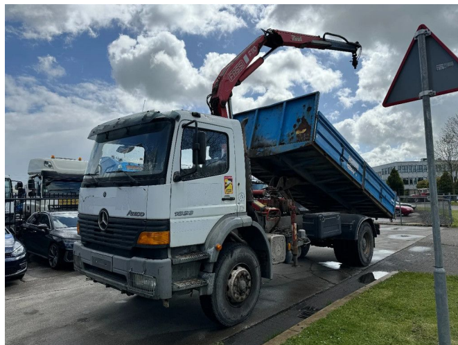
Mercedes-Benz Atego 1823 4X2 + FASSI F110A.21 + TIPPER... Referentienummer: MB533337