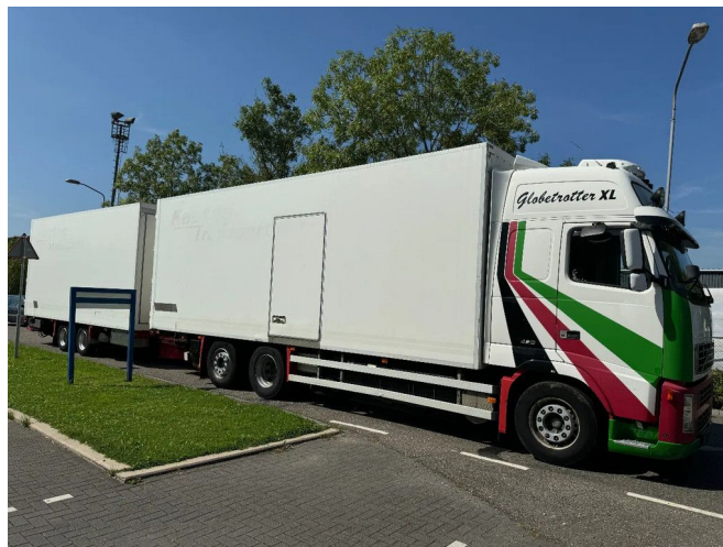
Volvo FH 12.420 6X2 - EURO 3 + HANGER NETAM-FRUEH...