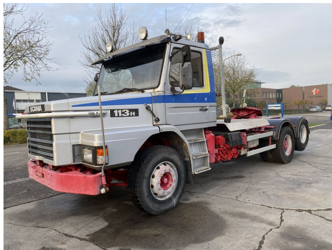
Scania T113-360 6X2 - MANUAL - FULL STEEL