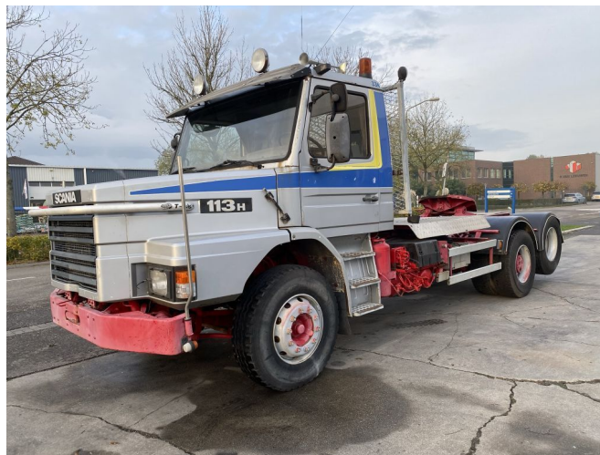
Scania T113-360 6X2 - MANUAL - FULL STEEL