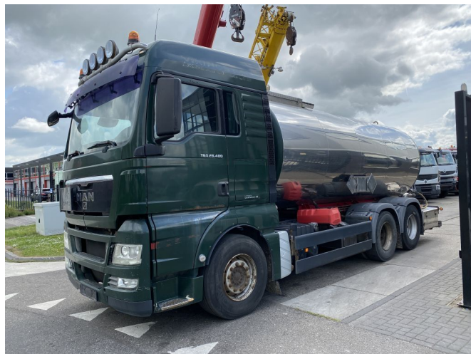
MAN TGX 28.480 6X2 MANUAL + 15.000 LITER - BITUM TANK