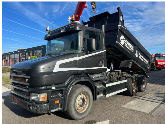
Scania T124-400 6X4 FULL STEEL MANUEL