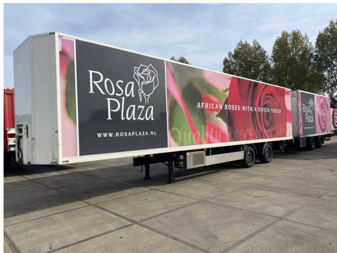
Burg LZV COMBI MET DRACO WZ-30-RF