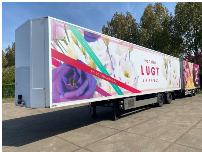
DRACO 2 AXEL FLOWER TRAILER