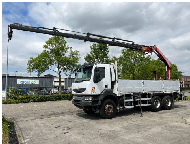
Renault Kerax 430 6X4 EURO 5 + FASSI F210AC.25 + REM...