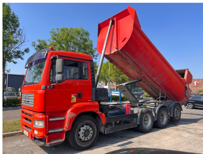
MAN TGA 35.400 8X4 INTARDER - ASPHALT TIPPER