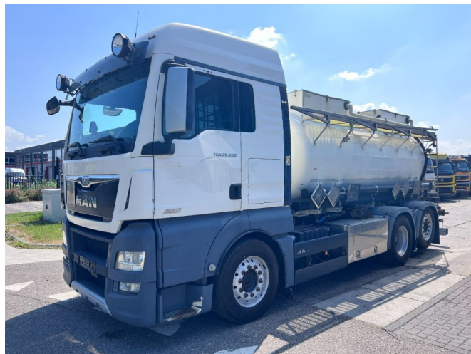
MAN TGX 26.560 6X2 EURO 6 - 11.500L VACUUM CLEANER...