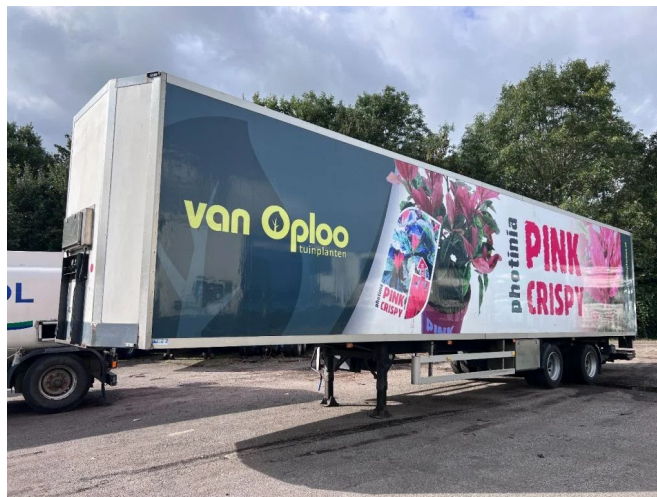
Burg BPO 12 - 2x BPW 13.6x 2.5x 2.67