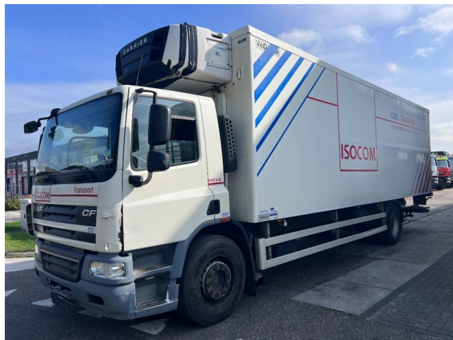
DAF CF 75.250 4X2 CARRIER SUPRA D/E + DHOLLANDIA