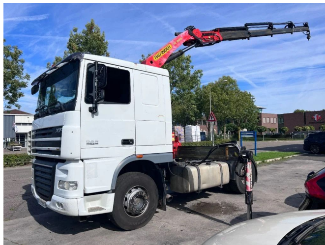
DAF XF 105.410 4X2 EURO 5 MANUAL + PALFINGER PK16...