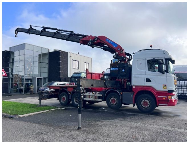
Scania R490 8X2 EURO 6 + EFFER 1750/4S + REMOTE