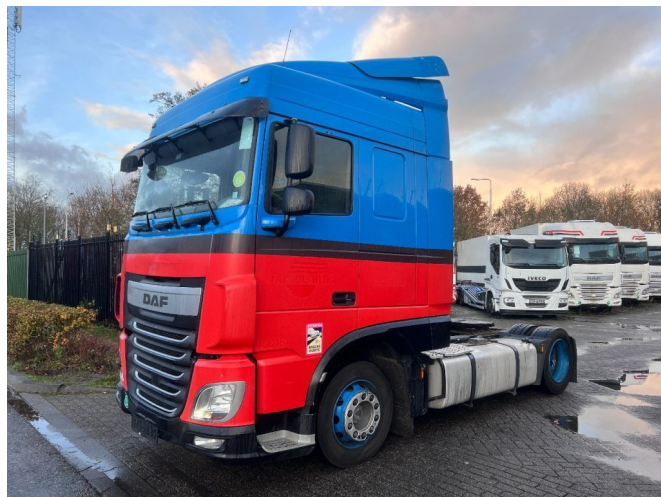
DAF XF 440 SC 4X2 MEGA 671.119km