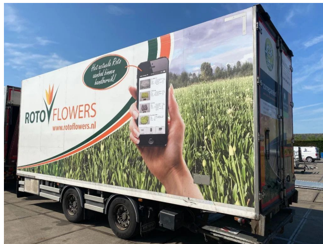
DRACO 2 AS - SAF + FRIGOBLOCK