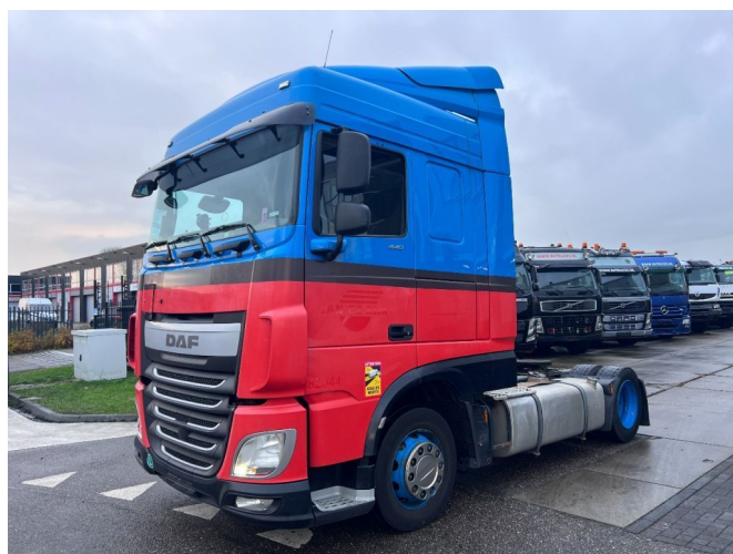
DAF XF 440 SC 4X2 EURO 6 MEGA