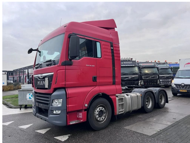
MAN TGX 28.500 XLX 6X2 EURO 6 RETARDER