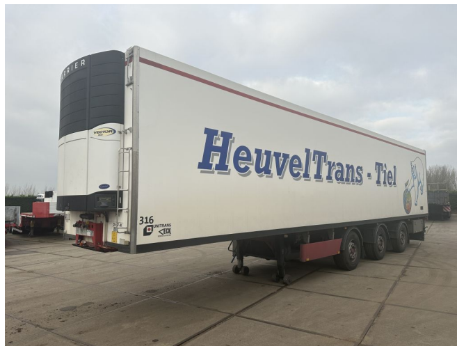
VAN ECK Carrier Maxima 1800