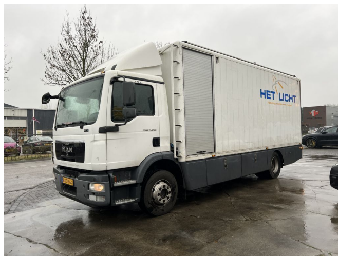
MAN TGM 15.250 4X2 - EURO 5 - ONLY 83.192 KM + BOX 6...