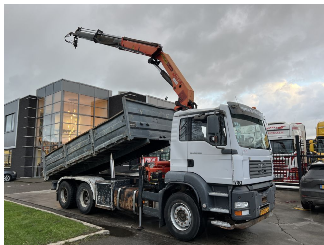
MAN TGA 26.390 6X4 + PALFINGER PK17502 + TIPPER - F...