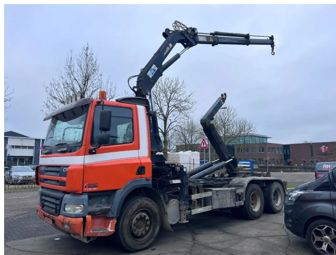
DAF CF 85.380 6X2 + MKG 141 A2 CRANE + 20 TON HOOK...