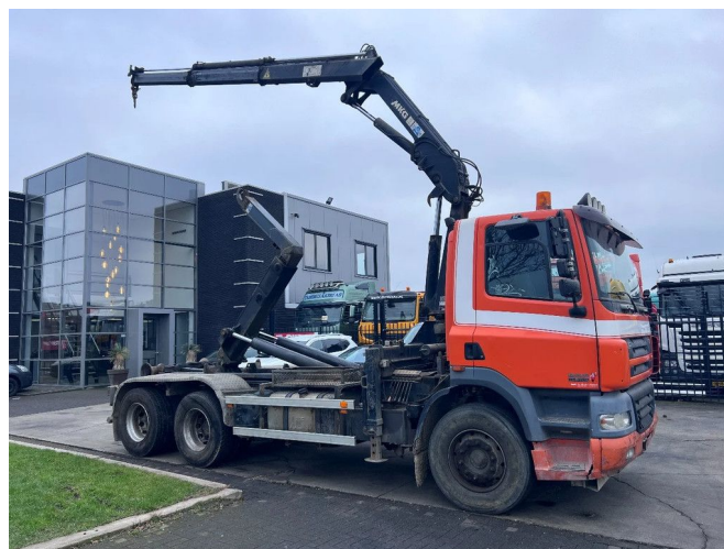
DAF CF 85.380 6X2 + MKG 141 A2 CRANE + 20 TON HOOK...