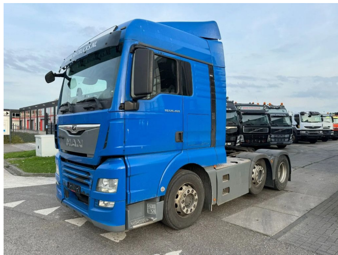
MAN TGX 26.460 6X2 EURO 6