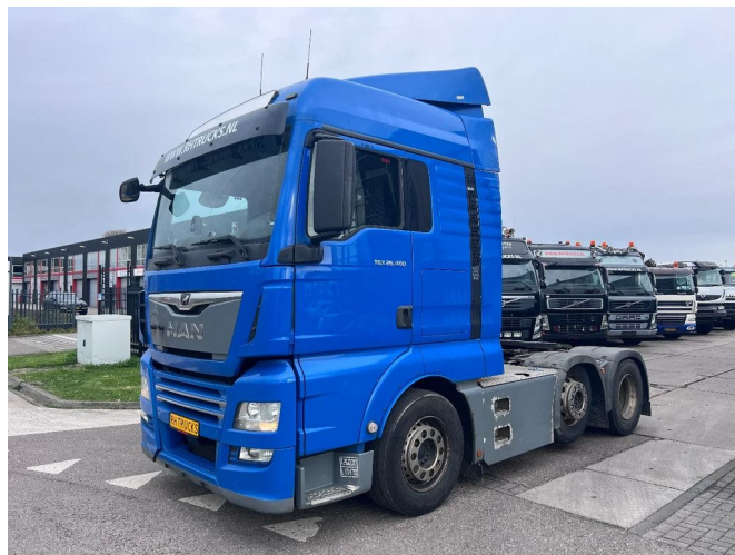
MAN TGX 26.460 6X2-2 EURO 6 LIFT AXLE