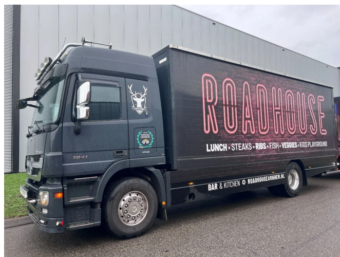
Mercedes-Benz Actros 1841 4X2 EURO 5 249.088km