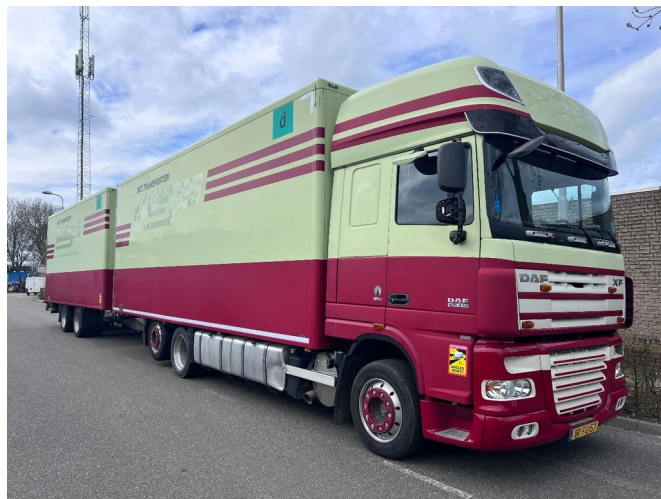
DAF XF 105.410 SSC 6X2 EURO 5 + FLIEGL 2 AXLE