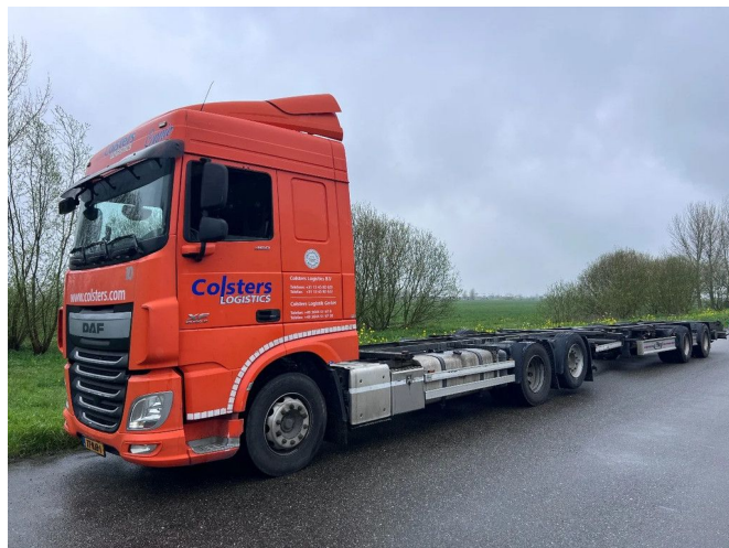
DAF XF 460 6X2 EURO 6 BDF + 2015 FLIEGL 2 AXLE