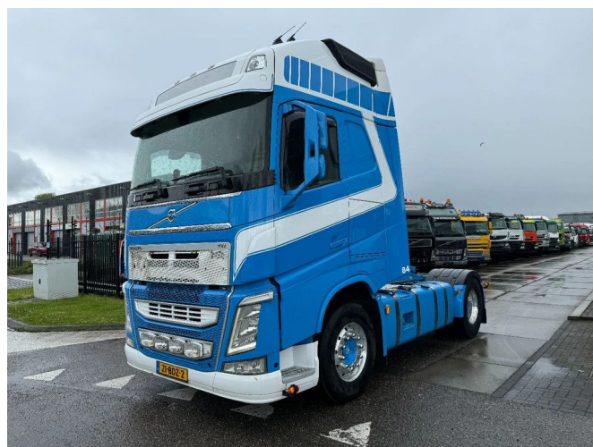
Volvo FH 460 4X2 EURO 6 + ADR