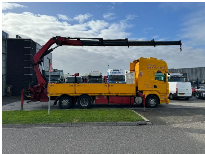
Scania R500 V8 6X2 EURO 5 + HIAB 377EP-4XS + REMOTE...