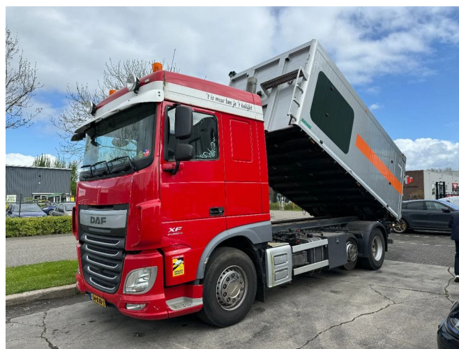
DAF XF 460 6X2 EURO 6 + TIPPER