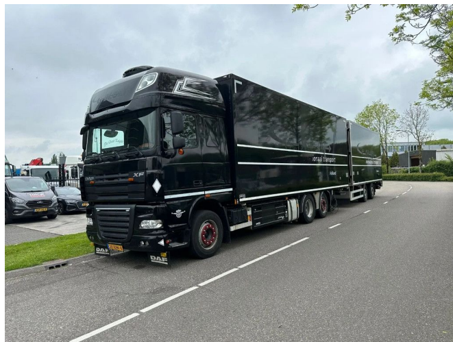
DAF XF 105.460 6X2 EURO 5 MET AANHANGER THERMOK...