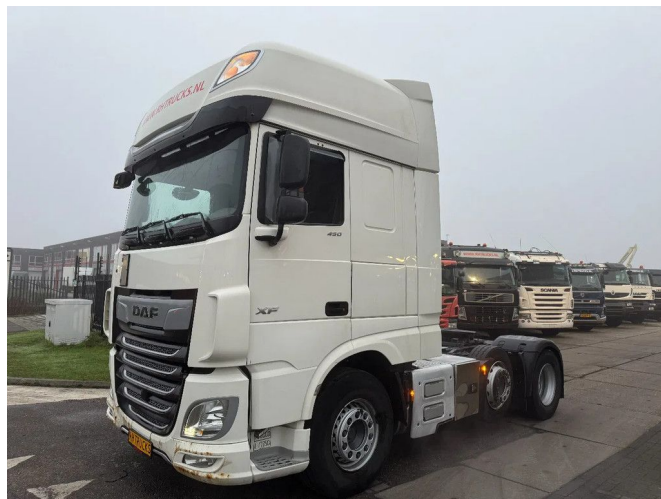
DAF XF 450 6X2 - EURO 6 + LIFT/STEERING AXLE 6x4