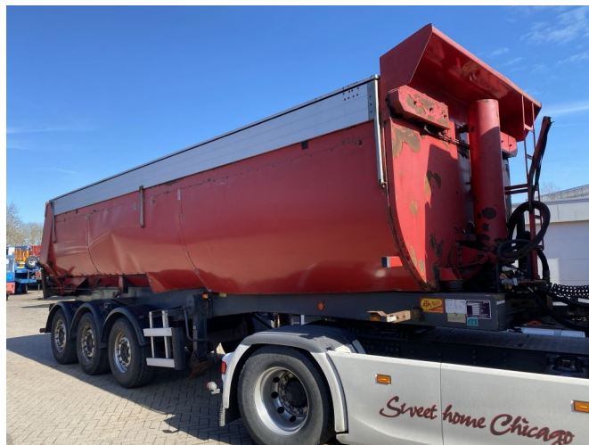
ATM OKA 17/27 - 3 AXLE