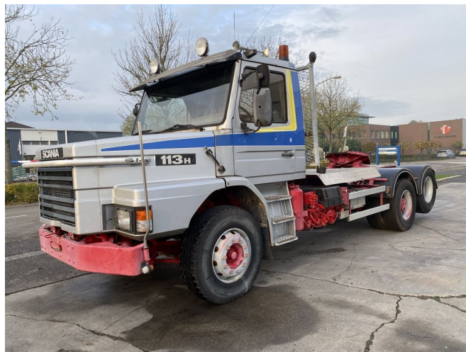
Scania T113-360 6X2 - MANUAL - FULL STEEL