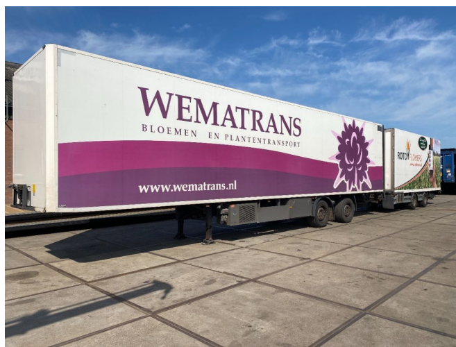
DRACO LZV COMBI MET DRACO WZ-VS-35