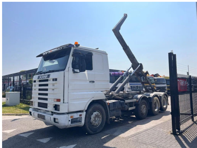
Scania R113-380 8X2/4L - HOOKLIFT - MANUAL GEARBOX