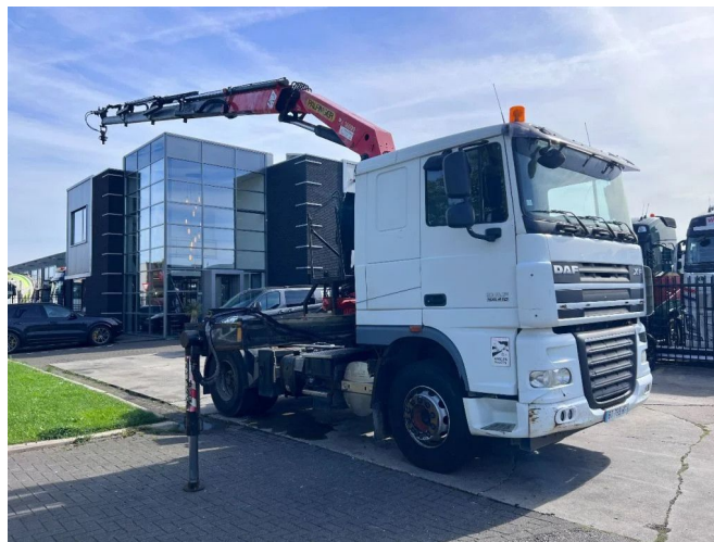
DAF XF 105.410 4X2 EURO 5 MANUAL + PALFINGER PK16...