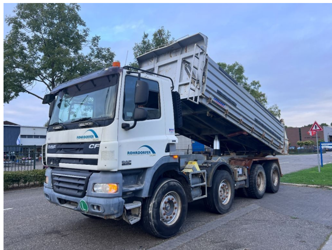
DAF CF 85.410 8x4 FULL STEEL MANUAL GEARBOX