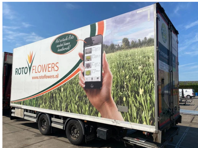
DRACO 2 AS - SAF + FRIGOBLOCK