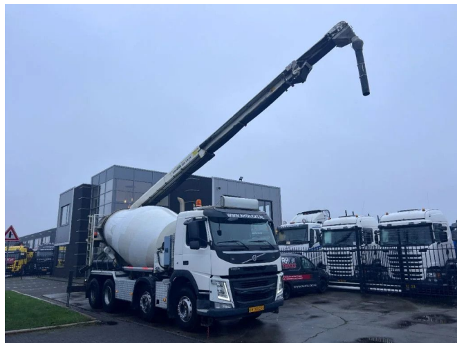
Volvo FM 410 8X4 MIXER 9m3 + LIEBHERR CONVEYOR BELT