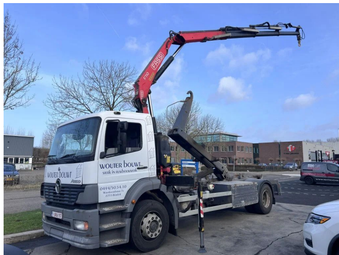
Mercedes-Benz Atego 1923 + 2011 FASSI F110 + 2011 ... 4x2