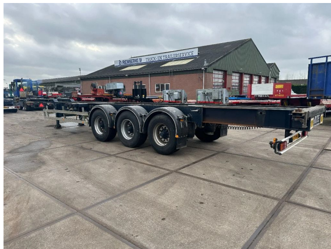
HRD 8X IN STOCK 20-40-45 FT