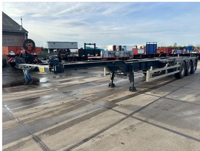
HRD 8X IN STOCK 20-40-45 FT