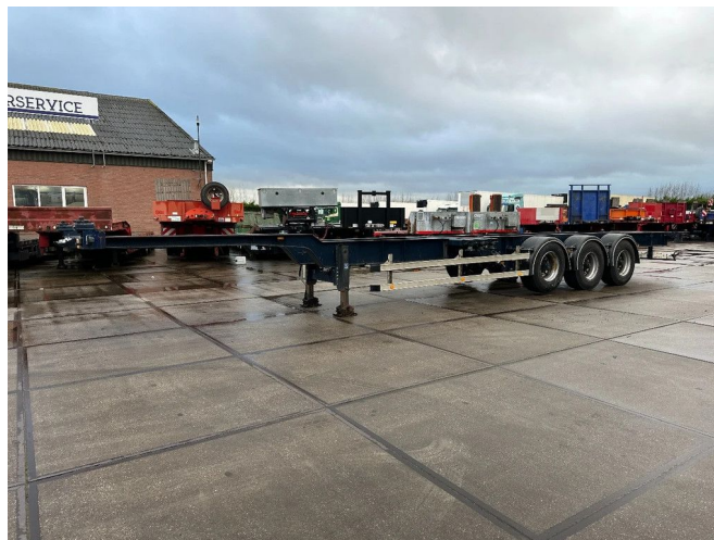
HRD HRD 8X IN STOCK 20-40-45 FT