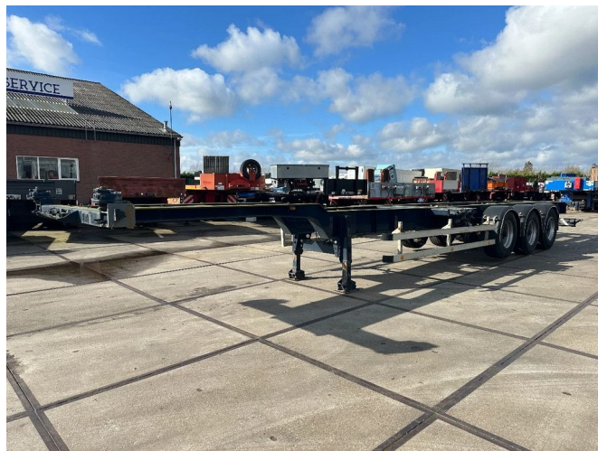
HRD 8X IN STOCK 20-40-45 FT LIFAXEL