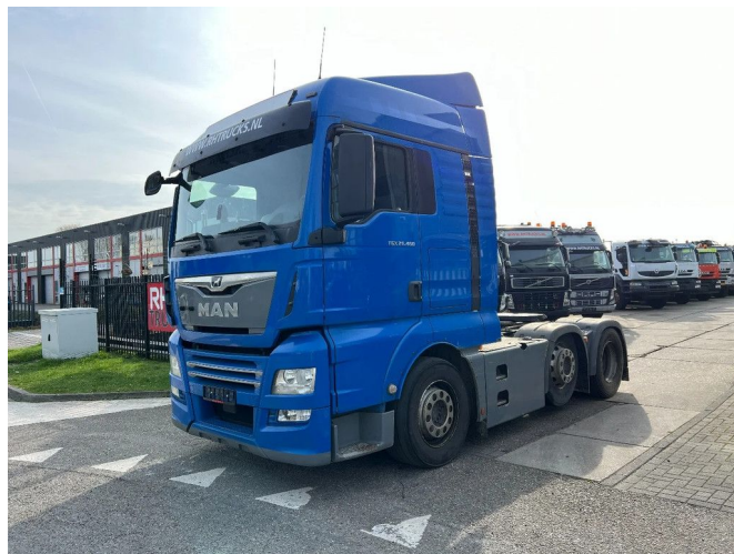
MAN TGX 26.460 6X2 EURO 6 + HYDRAULICS